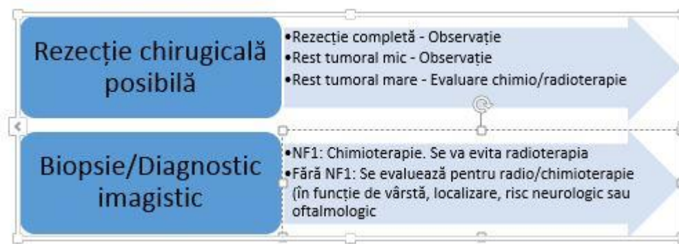
Figura 1: Principiile tratamentului multimodal în LGG

Principiile tratamentului multimodal în LGG sunt prezentate în Figura 1.